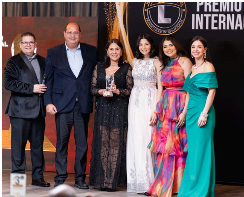
Planet Learning, Líder en Excelencia Académica 2025

Como reconocimiento a ésta destacada labor, Planet Learning Preschool fue galardonado el 26 de marzo de 2026, durante la Cuarta Noche de Líderes de Georgia, con el Premio Líder Internacional por ser Líder en Excelencia Académica 2025, distinción que resalta su compromiso con una educación de calidad y profundamente humana.