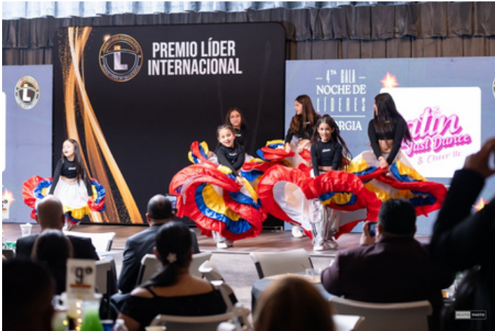
Latin Just Dance and Cheer